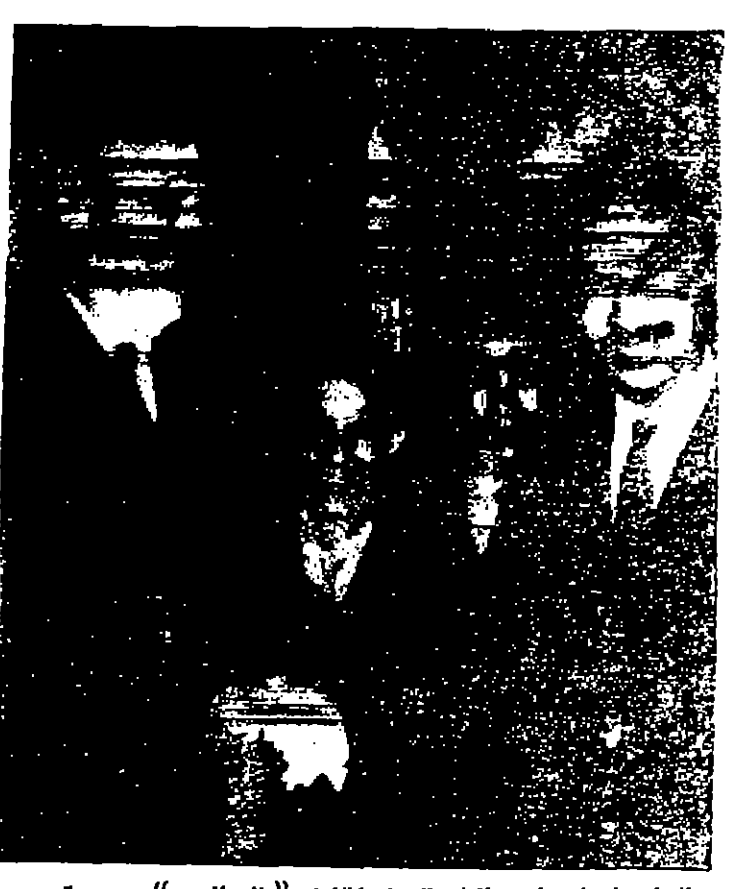
انزل حاربان رئيس الوفد العربي المفاوض «الى الجين» وهو يصطحب نائب رئيس جمهورية النجديسة...